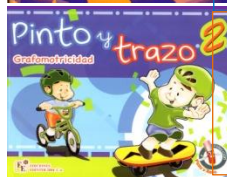
PINTO Y TRAZO 2