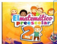
EL MATEMATICO PREESCOLAR 2